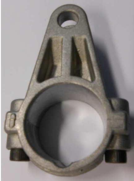
HAWK NMT-NPM OLD CONNECTING ROD